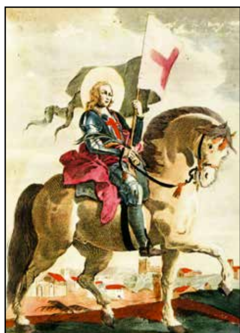
Il S. Pancrazio patrono di Montichiari.

Spicca la spesa per l'acquisto dell'edificio che ospita i Vigili