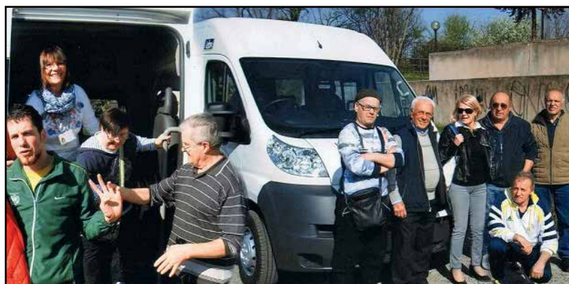
Volontari e disabili festeggiano il nuovo pulmino.

Importante e grande regalo per la S. Pasqua, molto apprezzato e festeggiato, da parte dei ragazzi frequentanti il Centro -CDD- sul monte S. Pancrazio a Montichiari, della Cooperativa Onlus "La Sorgente", l'arrivo del nuovo Pulmino che ha sostituito quello ormai inutilizzabile. Contenti e soddisfatti anche il Gruppo di volontari, autisti ed accompagnatori, per una guida migliore e più sicura, senza l'apprensione di doversi fermare ad ogni curva. Un po' meno allegre le casse della Cooperativa "La Sorgente" che per l'acquisto del nuovo Pulmino, 9 posti di cui uno in carrozzella, ha dovuto approdare ad un finanziamento, visto l'alto costo dell'automezzo.