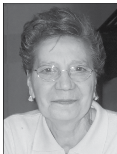
Marcella Bregoli in Marella 1° anniversario