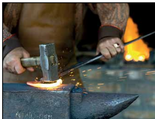
Fabro al lavoro.

Il nonno paterno era pure un provetto artigiano, figura per me quasi mitica che mi accompagnò nella mia infanzia. In vacanza da lui per diversi mesi all'anno, mi teneva vicino nel suo sgabuzzino laboratorio dove godevo delle sue ingegnosità nell'utilizzo di