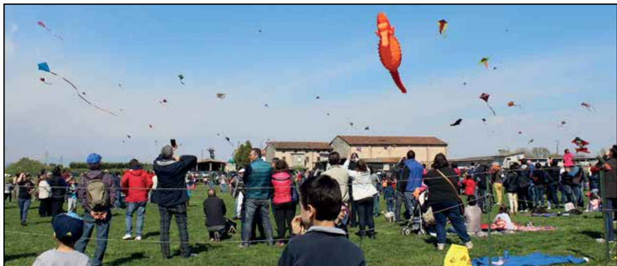
Un cielo colorato da centinaia di aquiloni.