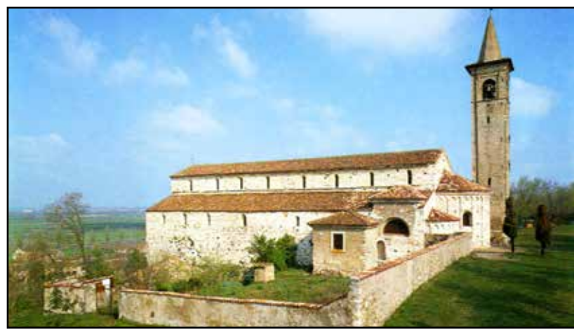
La Pieve di S. Pancrazio, fra le più antiche ed importanti del bresciano.