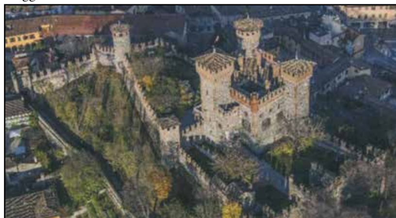
Il castello Bonoris: una opportunità da valorizzare.

I visitatori ed i turisti possono usufruire della segreteria di Montichiari Musei per eventuali ulteriori informazioni sui costi del BIGLIETTO d'INGRESSO e per prenotare la propria partecipazione tel. 030 9650455.