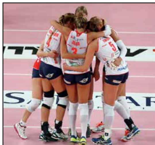
L'abbraccio finale al termine di una stagione meravigliosa.

KEBAB-FALAFEL-COUS COUS-RISO AL CURRY-KEBBE-TOSKA-BUREK